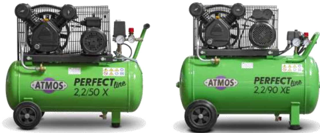
Foto: pístový kompresor Perfect line 2,2/50 X a Perfect line 2,2/90 XE

Technické změny vyhrazeny bez předchozího upozornění!