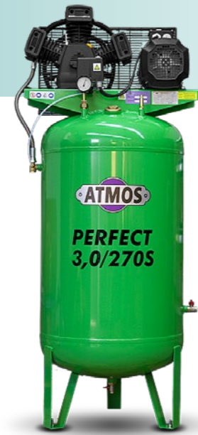
na vertikálním vzdušníku