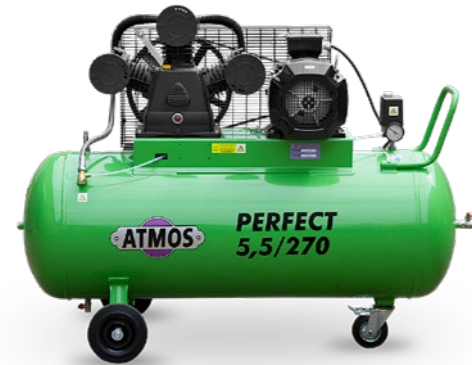
na horizontálním vzdušníku